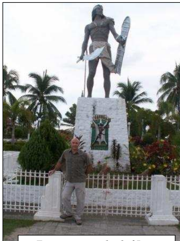
Fameuse statue du chef Lapu Lapu, érigée sur l'île de Mactan, à l'endroit où Magellan a été tué en 1521