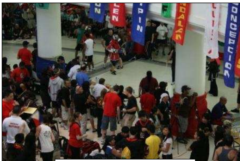
Les aires de combats dans l'AYALA MALL à CEBU

Le Championnat du Monde WEKAF 2008 de Kali Arnis Eskrima a eu lieu les 23, 24 et 25 juillet derniers à Cebu (Philippines).